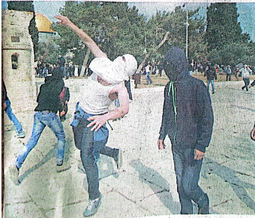
شبان فلسطينيين يتصدون لقوات الاحتلال

وبدأت قوات الاحتلال بنشر المزيد من عناصرها ووحداتها الخاصة في القدس المحتلة،